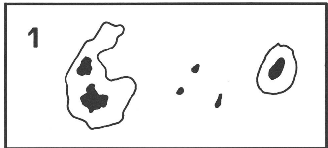
Abb. 1: Muster einer Sonnenfleckengruppe nach Beispiel 1, siehe Text.

Hier erfolgt die Darstellung der Sonnenfleckengruppe, spe-