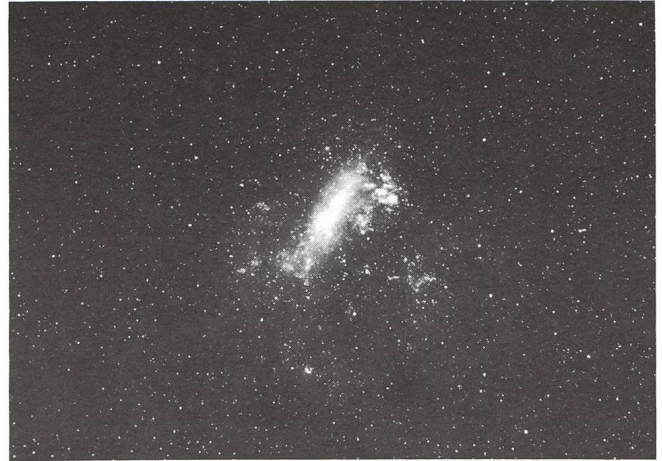
Abb.8. Die Grosse Magellansche Wolke. 10.4.86, 18.35 UT, Belichtung 10min auf TP 2415 hyper., 55mm, Blende 2.8.

Adresse des Autors: DR. HELMUT KAISER-MAUER, Burgfelder mattweg 27, CH-4123 Allschwil