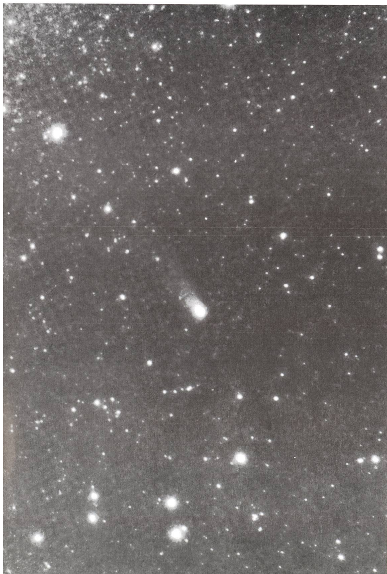
11.11.87, B = 14 m, agrandissement 6 fois