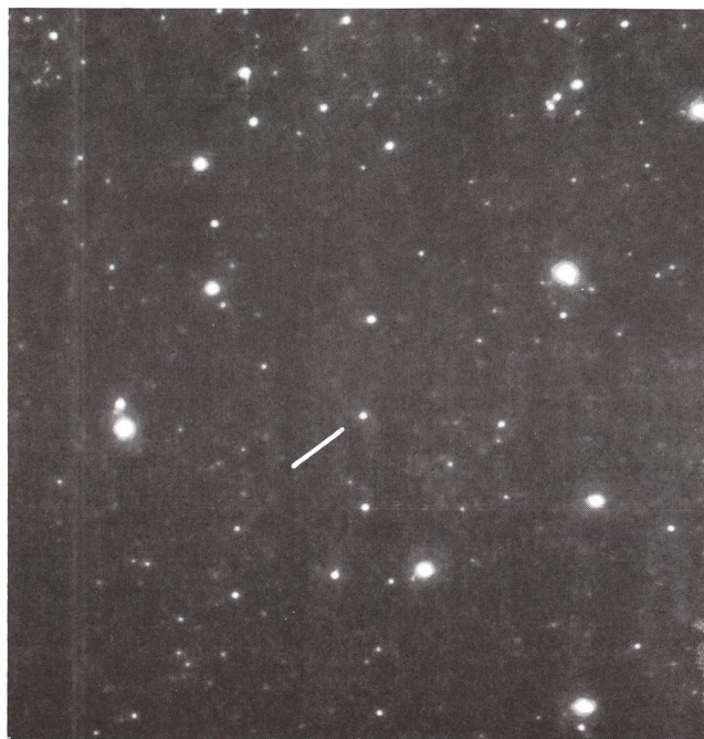
23.12.87. 18.10- 18.25. Tri × 320 ISO mp 7,7.