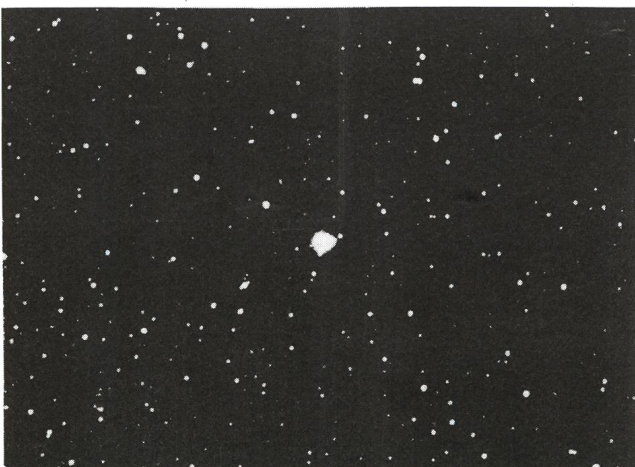
Komet P/Brorsen-Metcalf 1847V, Film TP 2415 hyp. - Bel. 3 min., - Schmidt 5,5'' - 15.8.89, 0235 h UT -, Foto U. Straumann, 4059 Basel.

ARMIN MÜLLER, Neuwiesenstr. 33, CH-8706 Meilen