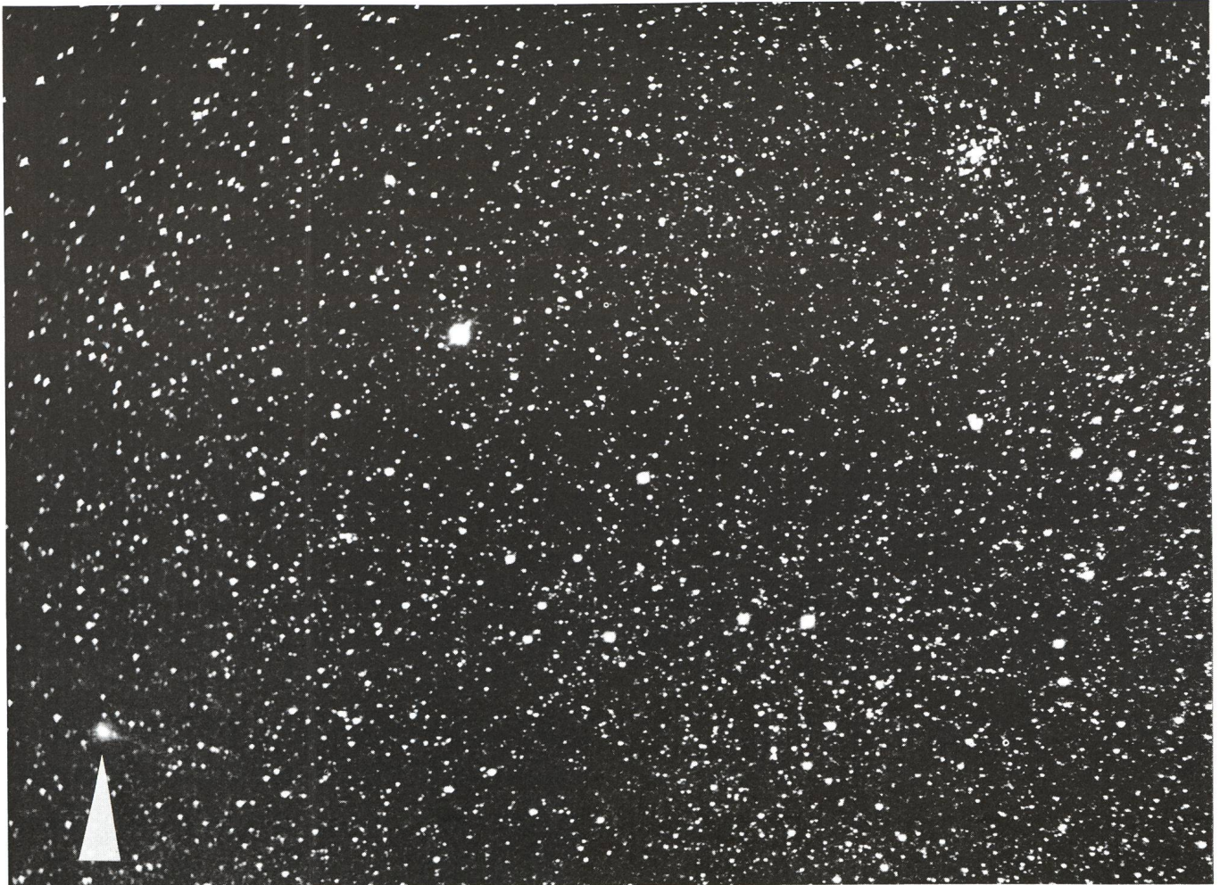
Komet Brorsen-Metcalf am 2. August 1989 2h50' - 3h 35' MESZ. Aufnahme mit Rucksack-Astrograph 56×220 mm auf Orwo Astroplatte ZU 21, nachgeführt von Hand an Algol (hellster Stern); oben OH M34. Ort: Alpe Montascio (Lopagno Ti) 920 m ü.M.

chen (10×40) den Sternen nachgeführt werden, sodass sich der Komet infolge Eigenbewegung etwas deformiert abbildet. Die Andeutung eines kurzen Schweifes ist auf dem Originallegetiv erkennbar.