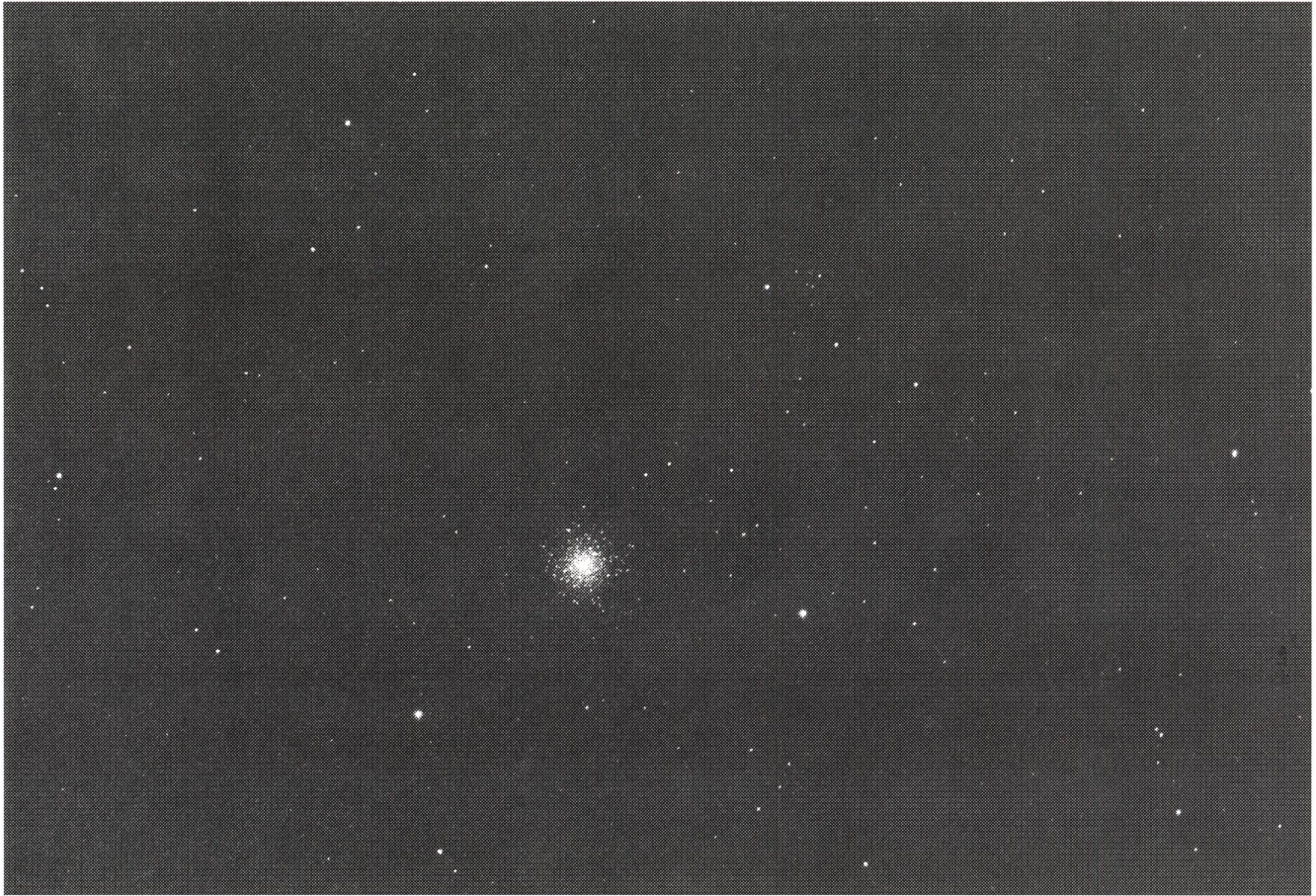
Amas globulaire M13, Mercurius; T254/1145, 18 min. sur Ektar 1000. 30.7.92, 2230 HEC

cliché, mais cruellement évidents à l'oculaire de guidage où un grossissement élevé est de règle. On n'obtient jamais une image d'étoile bien « piquée », et ce fait exclut des astres très faibles. Il y a donc avantage à pouvoir explorer une plage de ciel d'une certaine largeur pour trouver la bonne étoile ; cela facilite également le cadrage du cliché. Autant d'arguments qui prèchent pour un correcteur de champ au diamètre optique dépassant un peu les 42 - 46 mm des modèles du commerce.