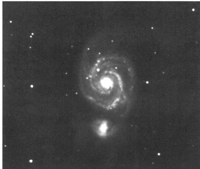
M 51 - NGC 5194

MEADE LX6 10 pouces F/D 6.3 L'Isle (VD), le 29.06.92 à 00 h.06 (heure locale) pose de 90 minutes - suivi électronique ST4 Film: TP241 5 Hypersensibilisation: N 2 à 30° C - 10 psi - 24 heures H 2 à 30° C - 10 psi 72 heures