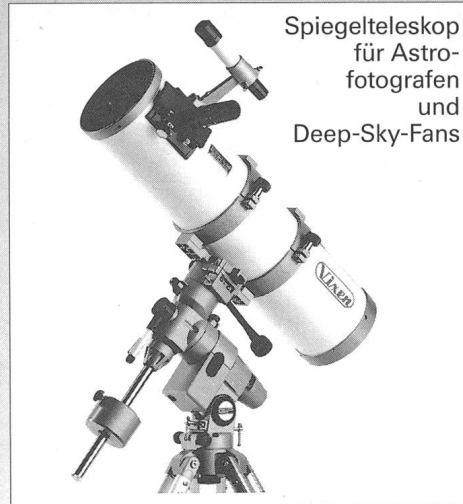
Spiegelteleskop für Astrofotografen und Deep-Sky-Fans