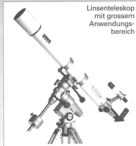
Linsenteleskop mit grossem Anwendungsbereich