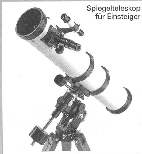
Spiegelteleskop für Einsteiger