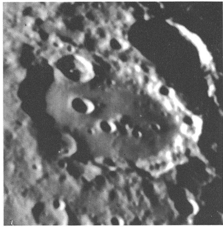
Mondkrater Clavius, fotografiert mit Vixen FL-80 S

Die Vixen-Erfolgsformel für Freude an der Astronomie