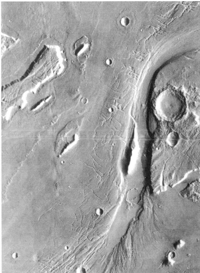
Bild 3. Alle Bildinformation dieser Aufnahme entstammt einem einzigen hochauflösenden Bild der MDIM. Da das Bild im Normalmassstab grösser ist als ein 16-Zoll Apple-Bildschirm, wurden zwei Bildteile nacheinander abfotografiert und für diese Reproduktion zusammenmontiert. Die gezeigte Region liegt bei 25°N / 72°W und bildet einen kleinen Teil des riesigen Kasei Vallis-Talkomplexes. Vielfältige, stromlinienförmige Geländestrukturen weisen auf gewaltige Erosion durch wahrscheinlich katastrophal ausgebrochene Wassermassen hin. Man beachte den beinahe vollständig abgeschwemmten Wall eines mittelgrossen Impaktkraters am Boden des auffälligen Flusstales (unteres Bilddrittel).