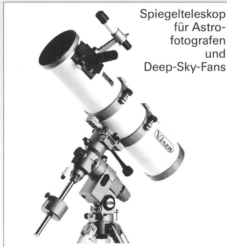
Spiegelteleskop für Astrofotografen und Deep-Sky-Fans