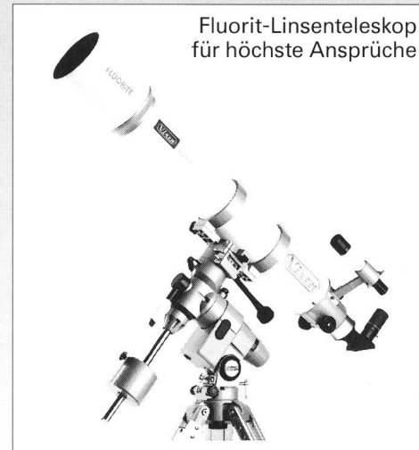
Fluorit-Linsenteleskop für höchste Ansprüche