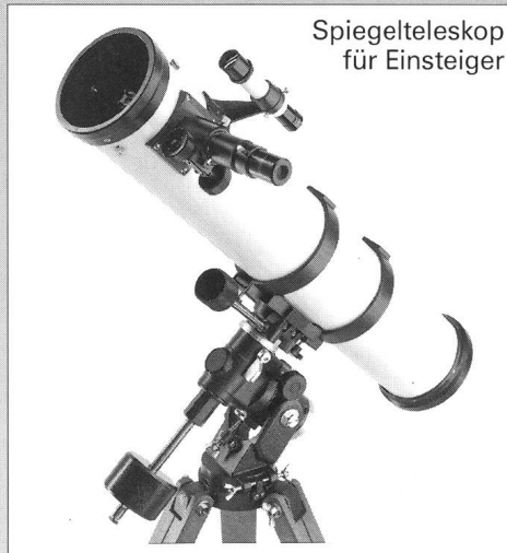
Spiegelteleskop für Einsteiger