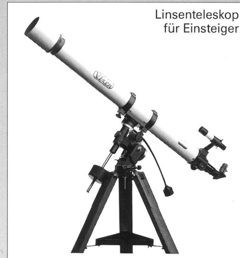
Linsenteleskop für Einsteiger