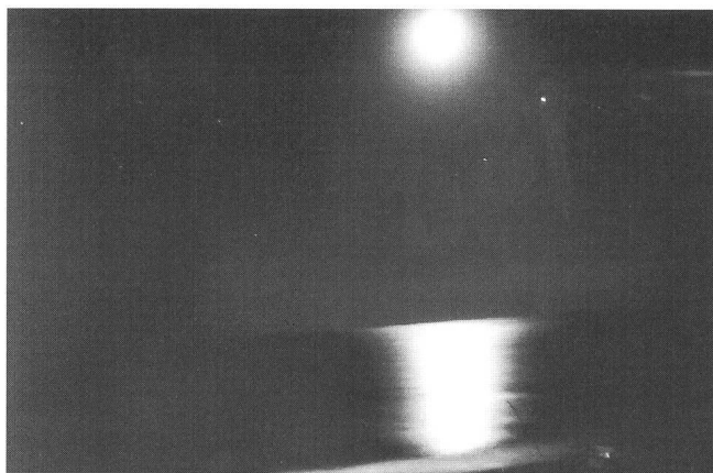
Bild 1) 2. September 1995; 22.10 Uhr; Roccamare (Italien) gegenüber Elba. Nikon F-301, 28 mm, Kodak Ektachrom 200 Professional.

Abteilung für Onkologie, Departement für Innere Medizin Universitätsspital, CH-8091 Zürich