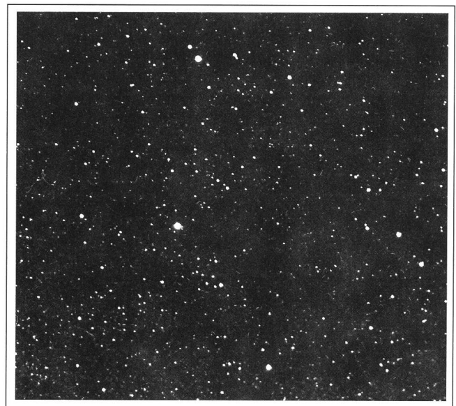
12.10.1995 (oberer Kreis in Karte rechts) Belichtungszeit: 1815-1830 UT Instrument: Schmidt-Kamera 400/1000mm Grenchenberg Film: TP4415 hyp