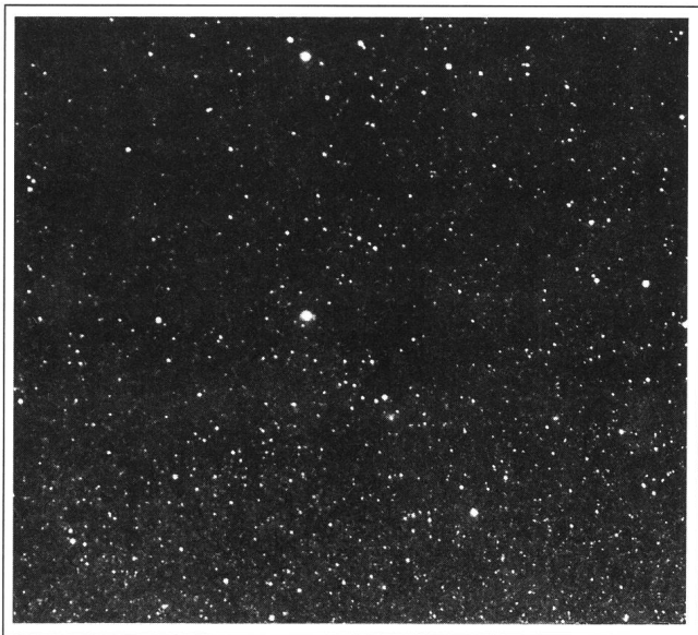
11.10.1995 (unterer Kreis in Karte rechts) Belichtungszeit: 1825-1840 UT Instrument: Schmidt-Kamera 400/1000mm Grenchenberg Film: TP4415 hyp