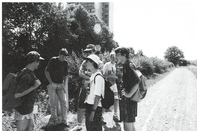
Foto 1: Exkursion einiger Jungmitglieder zum Planetenweg Effretikon im letzten Sommer.

Ich finde es gut, dass der Verein altersmässig durchmischt ist, denn so profitieren Junge und Alte. Einfach ausgedrückt: die Älteren haben viel Erfahrung, die den Jungen sehr nützlich ist,