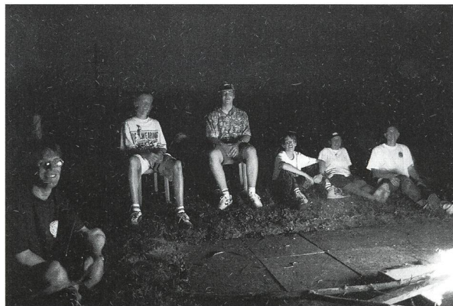
Foto 2: Am Abend: Gemütliche Stimmung beim Feuer unter dem funkelnden Sternenhimmel.

Glücklicherweise sind die Samstagabende für die Jungmitglieder reserviert, und so sind alternierend zwei Gruppen in der Sternwarte. Die dritte Gruppe schliesst sich manchmal der einen oder der anderen an oder trifft sich an einem freien Abend unter der Woche.