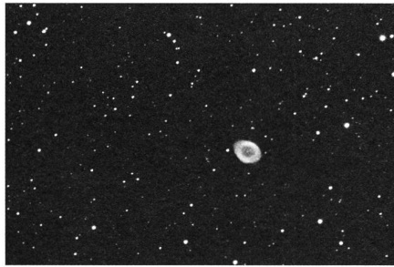
Fig. 7: M57.