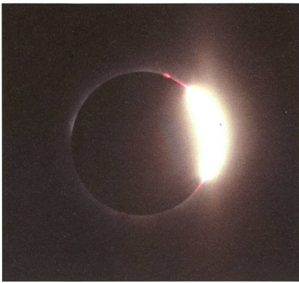
Fig. 4: Noch effektvoller war der 3. Kontakt. Wie weissglühendes Metall quoll das andere Ende der Sonne wieder hinter dem Mond hervor. Aufnahmen, wie in Figur 2.

von Hühnern und das Krähen eines Hahns. Sonst absolute Ruhe, ein Moment der Besinnung. Venus strahlte unübersehbar hell unter dem «himmlischen, schwarzen Loch»; einige von uns entdeckten sogar Beteigeuze im Orion. Wunderschöne Protuberanzen säumten den Sonnenrand, so hoch, dass man sie mühelos ohne Fernglas erkennen konnte.