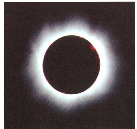
Fig. 3: Eine prächtige Maximums-Korona mit feinsten Strukturen leuchtete für 2 Minuten und 22 Sekunden über Ungarn. Aufnahmedaten: 500 mm-Teleobjektiv, Blende 8, 1/2 s auf Ektachrome Elite 100 ASA.

Zehn Minuten vor Totalitätsbeginn hatte sich auch das letzte Gewölk verzogen. Immer rascher ergoss sich's fahl über die Landschaft. Aus Nordwesten dunkelten die ersten Wolken ein; der Kernschatten hatte bereits das Burgenland erfasst. Jetzt ging alles rasend schnell. Immer dunkler wurde es am Beobachtungsplatz; die letzten Vorbereitungen liefen. Erste Reaktionen waren zu hören: «Nein, schau! Das ist ja gigantisch!» Noch zwei Minuten trennten uns von der Totalen. Jetzt konnten wir uns die Dämmerung in der Schweiz vorstellen. Die Bauern auf dem Felde unterbrachen ihre Arbeit, und die Störche standen wie erstarrt da. Unbeschreibliche Farben traten auf. Durch den Kamerasucher erblickte ich bereits die innere Sonnenkorona. Das gleissende Hell liess aber noch keine Blicke mit freiem Auge zu. Dann, um 12:46.40 Uhr standen wir im Dunkeln (Figur 2). Eine gigantische Maximums-Korona, deren feinsten Strukturen fast vier Monddurchmesser weit gleichmässig in alle Richtungen über den Sonnenrand ragten, fesselte uns zu tiefst (Figur 3). Die Zikaden hatten ihr Konzert unterbrochen, die Vögel waren verschwunden. Nur aus der Ferne vernahm ich das aufgeregte Gackern