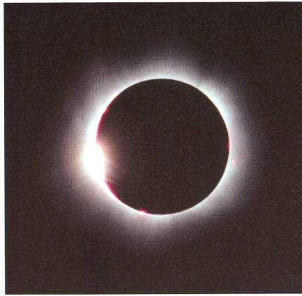
Fig. 2: Totale Sonnenfinsternis östlich von Szombathely um 12:46.6 Uhr MESZ. Gerade erlischt der letzte Sonnenstrahl am linken Mondrand. Aufnahmedaten: 500 mm-Teleobjektiv, Blende 8, 1/1000 s auf Ektachrome Elite 100 ASA.

Eine Familie aus Bülach gesellte sich zu unserer Equipe und genoss das grandiose Naturschauspiel mit uns. Das