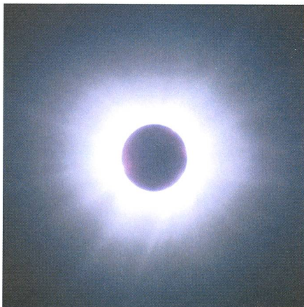
Fig. 3: 50 secondes avant le troisième contact: couronne extérieure montrant des rayons très effilés, on remarque l'effet de la brume de chaleur au moment de l'événement. Pose 1.5 s.

Quelques secondes déjà avant le deuxième contact, des protubérances très brillantes, la chromosphère d'un rose intense ainsi que des éléments de la couronne interne se détachèrent nettement (fig. 1). Plusieurs secondes durant, une profonde vallée lunaire laissa encore passer les derniers rayons solaires. Très vite, la couronne d'un blanc argenté se déploya sur environ quatre rayons solaires. Elle présentait la forme presque circulaire, caractéristique du maximum d'activité, avec des nuées denses à l'intérieur se terminant par des rayons effilés, entrecoupés de quelques «trous coronaires» (fig. 2 et 3).