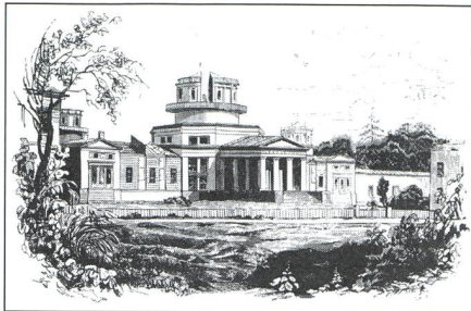
Pulkovo - Das Zentralobservatorium der Russischen Akademie der Wissenschaften - 4