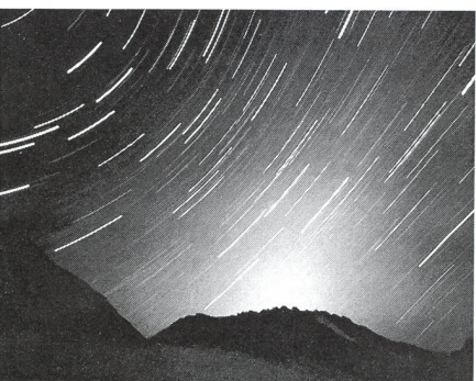
Astrophotographie - 16