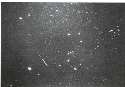
Une léonide à côté d'Orion - 29