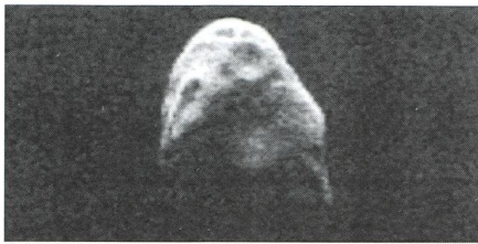
Asteroid 11547 trägt den Namen «Griesser» - 4