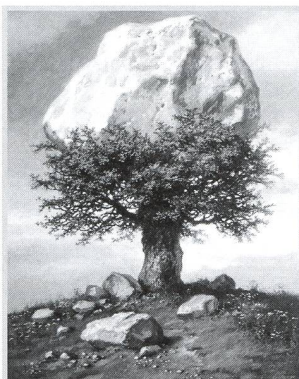
The art of Ludek Pesek - 15