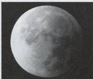
Totale Mondfinsternis vom 21. Januar 2000 - 20