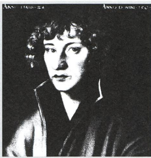
Eine astronomische Revolution vor 500 Jahren? - 4