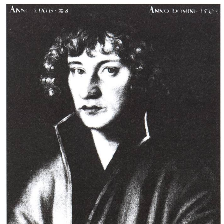
Fig. 3: Ein im Jahre 1509 entstandenes Porträt, das NICOLAUS COPERNICUS im Alter von 26 Jahren zeigt. Dem Maler diente ein Selbstbildnis von COPERNICUS aus dem Jahre 1498 als Vorlage.

Im Jahre 1491 immatrikulierte sich ein 18-jähriger junger Mann für das Wintersemester 1491/92 an der Universität Krakau: NICOLAUS COPERNICUS (1473-1543) aus dem polnischen Thorn (Fig. 3). Bis zum Sommersemester 1493 hörte er, neben den Künsten, vermutlich die allgemeinen Grundlagen der Astronomie (nach Sacrobosco), die Planeten- und Finsternistheorie (nach Peurbach) sowie die Berechnung der Himmelsercheinungen mit Hilfe von Planetentafeln (die Tabulae resolutae des PETER VON REYNE), die damals als Grundlage der medizinischen Astrologie und für jede Horoskopberechnung dienten. Er studierte vermutlich auch die Grundlagen der Kalender- und Zeitrechnung (nach dem 1474 erstmals erschienenen Kalender REGIOMONTANS), die Berechnung einer Sonnenuhr (mit Hilfe der