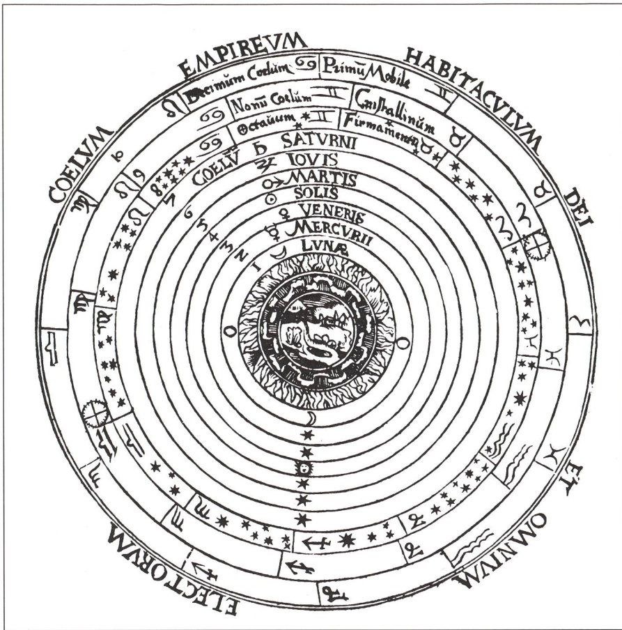
Fig. 2: Das antike geozentrische Weltsystem nach ARISTOTELES und PTOLEMÄUS. Im Zentrum ruht die Erde. Um sie kreisen in kristallinen Sphären Sonne, Mond, Planeten und Sterne. Man beachte die Reihenfolge: Erde, Wasser, Luft, Feuer, Mond, Merkur, Venus, Sonne...

Die spätmittelalterliche Scholastik befand sich im Spannungsfeld zwischen der Bewahrung antiker Traditionen und philosophischen Spekulationen, die den aristotelisch-ptolemäischen Ansichten widersprachen. So versuchte JOHANNES BURIDANUS (1290-1360), irdische und himmlische Bewegungen mit seiner Impetus-Theorie zu erklären und warf die Frage auf, ob nicht die Tagesdrehung des Fixsternhimmels als Achsendrehung der Erde beschrieben werden könne. Er argumentierte dabei mit der Analogie der Relativbewegung eines Schiffes (Erde) und dem Land (Himmel). NICOLAS ORESME (1320-1382), ein Schüler BURIDANS, entwickelte eine Methode zur graphischen Lösung kinematischer Probleme und konnte damit gewisse aristotelische Anschauungen widerlegen. Er diskutierte mit religiösen Argumenten eine mögliche Zentralstellung der Sonne. HEINRICH VON LANGENSTEIN (1325-1397) nahm die Gedanken von JOHANNES PHILOPONOS aus dem 6. Jh. über die einheitliche physikalische Beschreibung der irdischen und himmlischen Bewegungen wieder auf und integrierte die antiaristotelischen Konzepte, ähnlich wie WILHELM OCKHAM (1300-1350), in seine Naturerklärung. Nach der Ansicht des Neoplatonikers NICOLAUS CUSANUS (1401-1464) war das Weltall unendlich gross und hatte weder eine Mitte noch eine