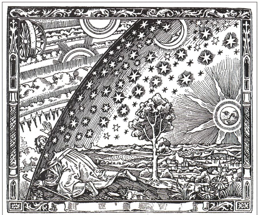
Fig. 5: Der Mensch durchbricht die Himmelssphären. FLAMMARIONS Holzschnitt aus dem Jahre 1888 stellt den Mythos von der Zertrümmerung des antiken Weltbildes durch die «Copernicanische Revolution» und dem darauffolgenden Verlust der zentralen Stellung des Menschen im Kosmos symbolisch dar.