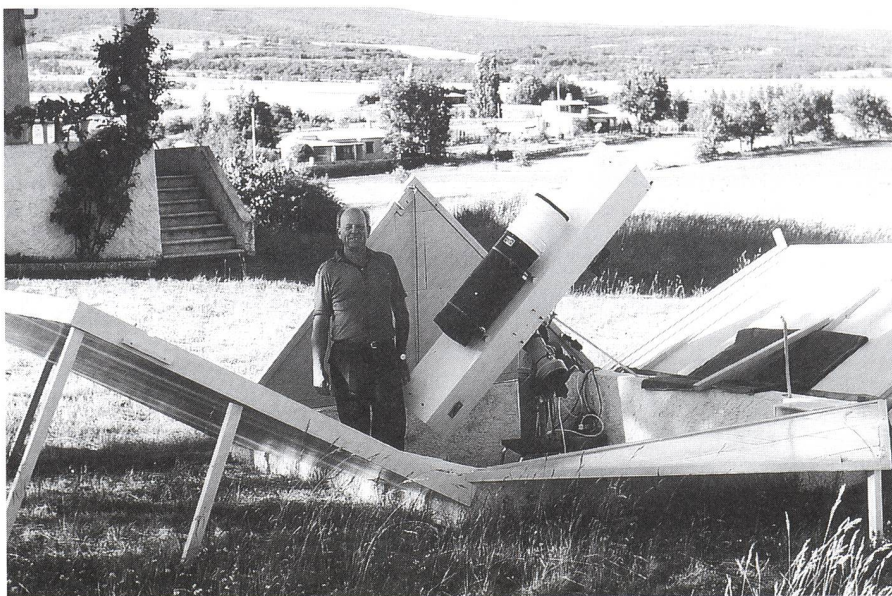
Fig. 1. Die Klapphütte mit dem 21-cm Newton und der 20/22/30-cm Schmidtkamera