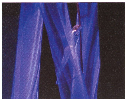
Figure 2: L'acrobate de la compagnie miméscope dans ses évolutions aériennes.