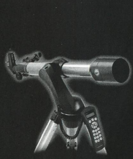
NexStar 60 GT

Schmidt-Cassegrain 279mm (11") et 2800mm de focale (f/10), Ordinateur GoTo avec plus de 50000 objets, alignement automatique grâce au GPS et à la boussole électronique. Tube compatible Fastar (f/2 CCD), prise Autoguider, Fonction PEC, poids du télescope / trépied : 29,5kg / 12kg