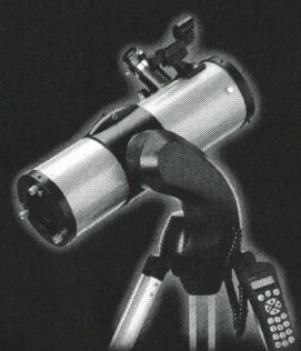
NexStar 114 GT