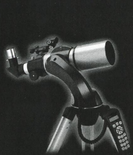
NexStar 80 GT