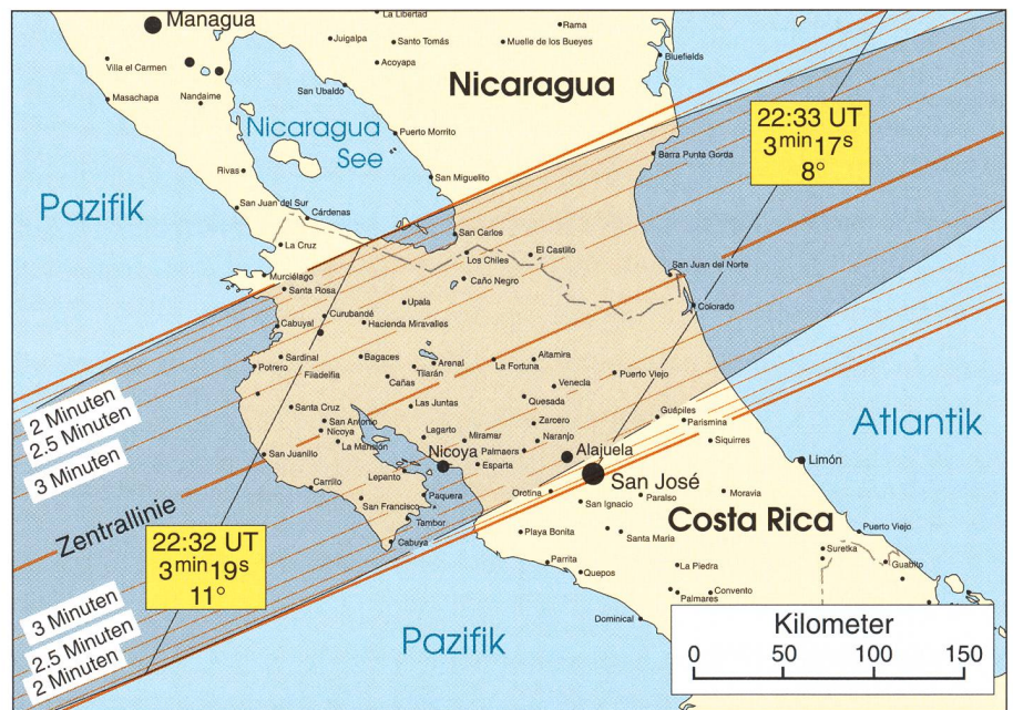
Figur 1: Verlauf der ringförmigen Sonnenfinsternis am 14. Dezember 2001 über Mittelamerika. (Grafik: THOMAS BAER)

Im landberührenden Abschnitt Nicaraguas und Costa Ricas kommen nur die grösseren Orte San José, Alajuela und Nicoya in die Ringförmigkeitszone zu liegen, wobei letztere Station mit 2 min