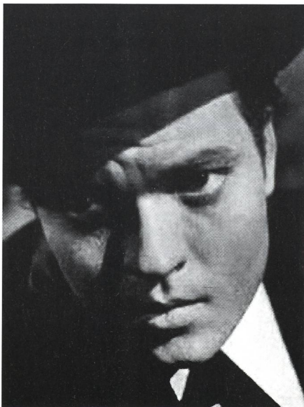
Fig. 1.: George Orson Welles (1915-1985).