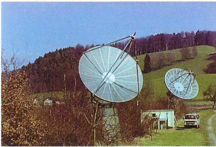
Fig. 2: Teleskope 5m-Spiegel links und 7m-Spiegel rechts.

21 cm (1415 MHz) und 10 cm (2800 MHz) wird jede Minute gemessen, kalibriert und auf einer WAP-Seite [2] dargestellt.