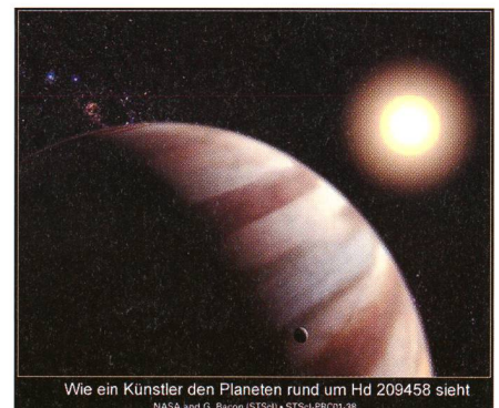
Fig. 1: Der Planet in der Sicht des Künstlers.

Bei dieser prekären Distanz zum Heimatstern wird die Atmosphäre des Planeten auf rund 1100 Grad Celsius aufgeheizt. Trotzdem ist der Planet gross genug, um seine kochende Atmosphäre festzuhalten.