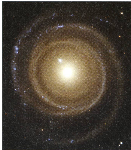
Fig. 1: Die Galaxie NGC 4622

Die Astronomen vermuten, dass die Galaxie eine Begegnung mit einer anderen Galaxie hatte. Es scheint, dass NGC 4622 sich eine andere, kleinere Galaxie einverleibt hat und dass dabei diese seltsame Armkonfiguration entstand.