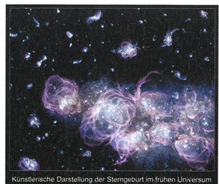
Fig. 1: Entstehung der ersten Sternengeneration aus Künstlersicht.

Die Dämmerung des Lichts, die sogenannte «Kosmische Renaissance», begann, als Wasserstoff in kleinen Gebieten zu kollabieren begann und den Punkt überschritt, an dem unter dem Einfluss der Gravitation die Kernfusion zündete und so die ersten Sterne bildete.