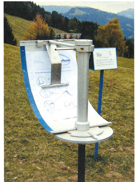
Le quadrant solaire. Der Sonnen-Quadrant.

Observatoire de Genève, CH-1290 Sauverny