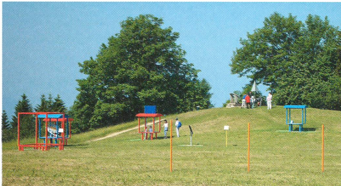
Vue générale du site.