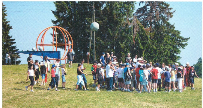
Un groupe d'écoliers fait connaissance du système solaire.