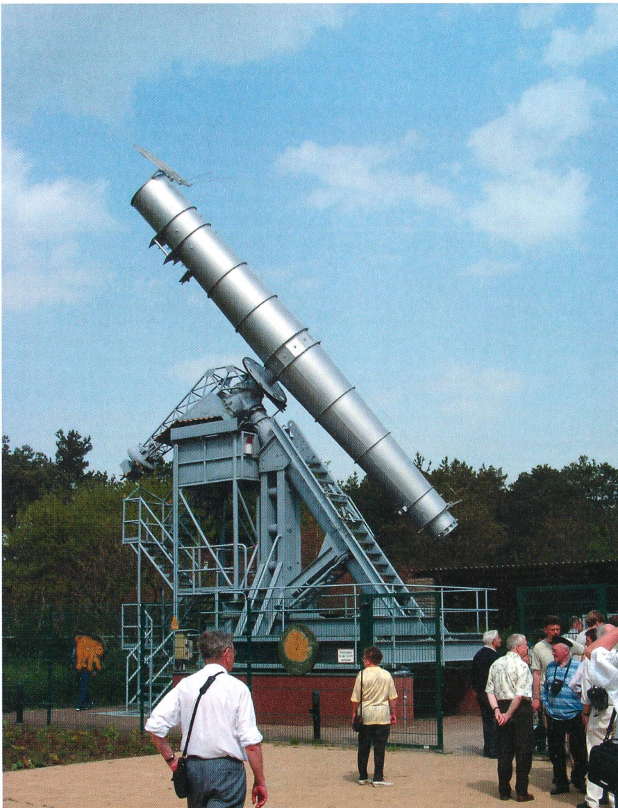
Fig. 1: Brachymedial-Fernrohr in Rathenow.