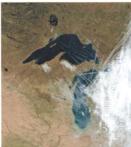
Une série de «contrails» persistantes flottent au-dessus de la région des Grands Lacs le 9 octobre 2000.

– B: Là, c'est le groupe de P. MINNIS, du NASA Langley Research Center, qui s'est penchée sur l'évolution de «contrails» au cours du temps. Ce fut plus particulièrement possible les jours d'interruption du trafic aérien commercial puisque les cieux étaient presque totalement dégagés et n'étaient fréquentés