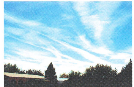
Un exemple de formation de nuages de haute altitude à partir de «contrails».

– Z: Elles agiraient donc comme des «fabriques à cirrus». Et on a observé des choses de ce genre?