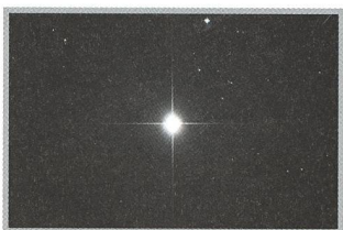
Der steinige Weg zu den Sternen - 24