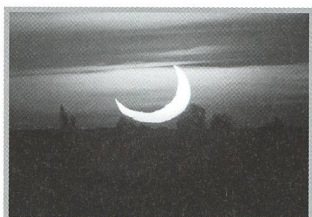
An Highlights mangelt's wahrlich nicht - 22