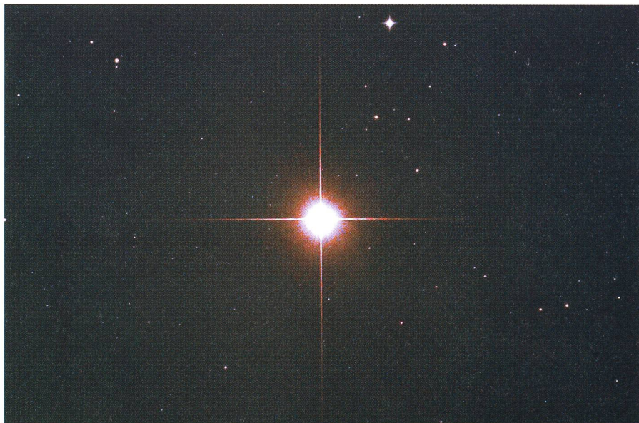
Der mit imposanten Beugungsfiguren am «Friedrich-Meier»-Teleskop fotografierte Einzelstern als Kartensujet für eine Geburtsanzeige (Details siehe Text).

Wer tagsüber in einem anspruchsvollen Beruf eine solide Leistung bringen muss, überlegt es sich gut, ob er auch in der Freizeit und über eine so lange Zeit leistungsorientiert arbeiten will. Nur eben: Ich habe mein Engagement für die Astronomie und ganz speziell den vor fünf Jahren erfolgten Einstieg in die wissenschaftliche Kleinplanetenbeobachtung nie als Arbeit und nur ganz selten als Belastung empfunden. Es ist ein riesiges und leider nicht sehr vielen Menschen vergönntes Privileg, sich so intensiv und leidenschaftlich in ein Fachgebiet einbringen zu dürfen, wie ich das bisher konnte. Dies hat auch stark mit meiner Familie, mit meiner Frau und meinen drei mittlerweile erwachsenen Töchtern zu tun. Sie erleben oft hautnah, was es heisst, einen Sternwart zum Gatten und als Vater zu haben, sei es tagsüber als Telefon-Ordnungen für buchungswillige Lehrpersonen