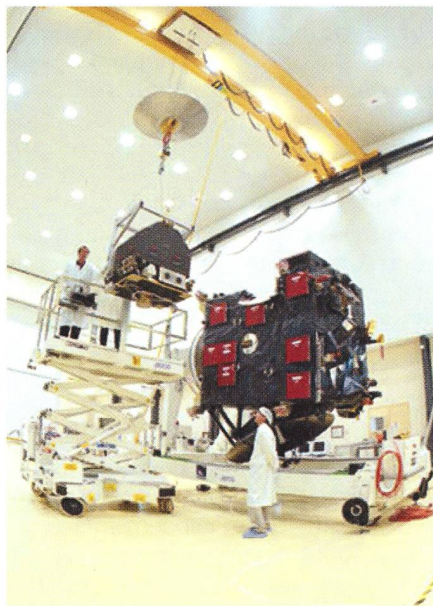
Fig. 4: Le module de surface.

La phase la plus difficile de la mission sera le rendez-vous avec la comète avec la manœuvre d'accord de l'orbite du vaisseau à celle de la comète. Ainsi, après des actions de freinage visant à ramener la vitesse relative entre la comète et Rosetta à environ 25 m/s, commencera la manœuvre d'orbite permettant de placer Rosetta en position de rencontrer la comète. Elle sera réalisée avant que les instruments optiques de Rosetta ne soient en mesure d'observer la comète, grâce aux observations au sol qui permettront un calcul précis de l'orbite de la comète.