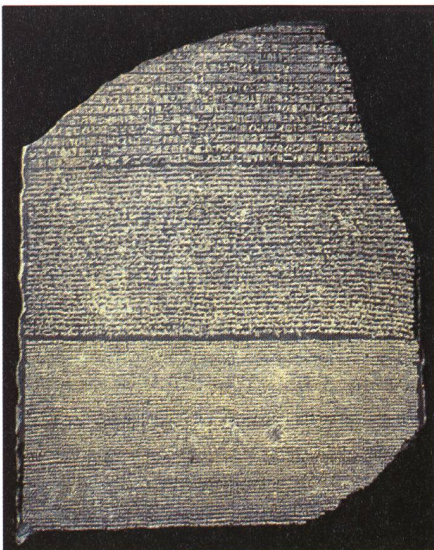
Fig. 1: la pierre de Rosette, actuellement exposée au British Museum à Londres.

L'odyssée de Rosetta devrait durer un peu plus de 10 ans. Le lancement sera effectué par une Ariane 5 depuis le port spatial européen de Kourou en Guyane française. La sonde spatiale de 3 tonnes sera dans un premier temps mise sur une orbite de parking avant d'être envoyé au-delà de la ceinture d'astéroïdes