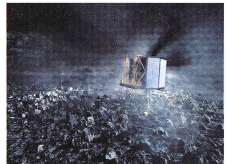
Fig. 4: Sur la comète.

A moins de 200 km du noyau des images montreront l'attitude de la comète, sa vitesse angulaire, les principaux sites possibles pour le module de surface ainsi que d'autres caractéristiques de base. Ensuite des manœuvres pourraient amener le vaisseau à une distance d'environ 35 km du noyau. La vitesse relative sera alors de quelques cm/s. L'orbiteur commencera alors une cartographie détaillée du noyau. A l'issue de ces observations, 5 sites seront choisis pour des observations rapprochées. Ces observations, qui pourraient durer 30 jours, amèneront une décision quant au site d'atterrissage.