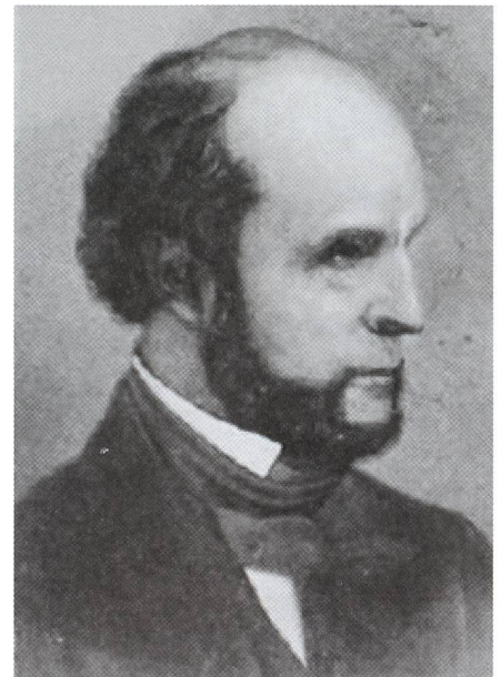
RICHARD ADAMS LOCKE (1800-1871), l'auteur du canular du «Sun».

Pour terminer, signalons que l'espièglerie de Locke fut appréciée par JOHN HERSCHEL lui-même et par l'Académie française des Sciences où les articles fu-