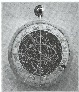
Astronomische Uhren, die hohe Kunst von Werner Anderegk - 9