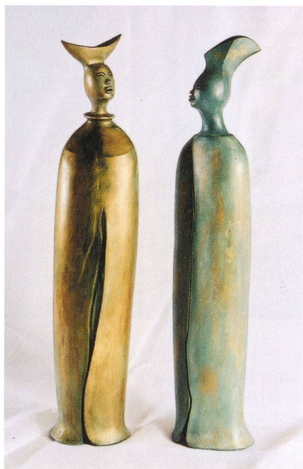
Fig. 12a et 12b – Grands êtres.