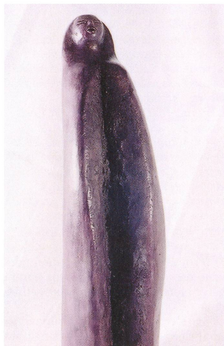
Fig. 11 – Convolution.