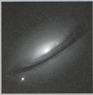
Die mysteriöse Dunkle Energie im Universum - 4