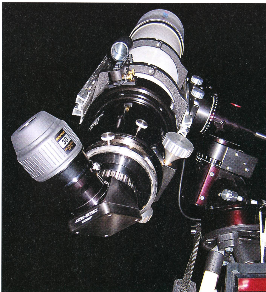
Das Pentax 30 mm XW am Astro Physics 155 mm EDF- Refraktor.