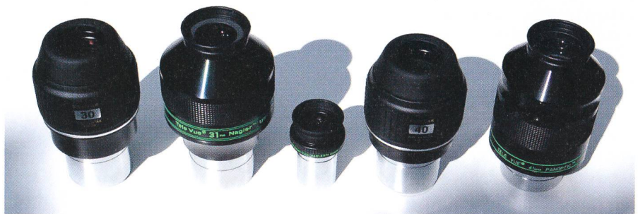
Die getesteten langbrennweitigen Pentax- und Tele Vue-Okulare: Pentax XW 30 mm, TV Nagler 31 mm, (TV Nagler Zoom 3-6 mm zum Grössenvergleich), Pentax XW 40 mm, TV Panoptic 41 mm (v.l.n.r.).

Ebenfalls in diesem Jahr hat Tele Vue zudem seine Panoptic-Okularserie (68° Eigengesichtsfeld) am langbrennweitigen Ende durch ein neues Zweizoll-Okular von 41 mm Brennweite ausgebaut. Was lag deshalb näher, als einen Vergleich der neuen Pentax XW-Okulare der Brennweiten 30 und 40 mm mit den TV-Okularen Nagler 31 mm und Panoptic 41 mm anzustellen? Getestet haben wir diese Okulare an zwei Refraktoren und zwei Newton-Teleskopen: Astro Physics 155 EDF (Öffnungsverhältnis 1:7.1), Pentax 75 SDHF (1:6.7), Ninja-Dobson 32 cm (1:4.5) und Eigenbau-Dobson 25 cm (1:4.8).