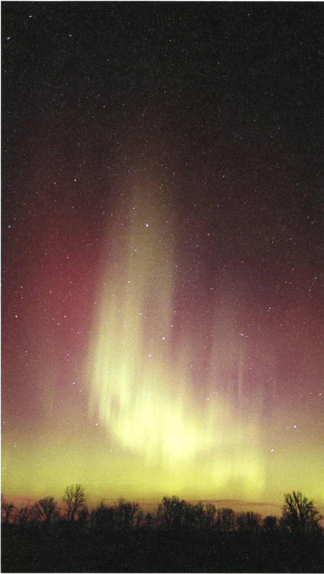
Fig. 2: 0537 UTC Film: Fuji NPZ (ISO 800) Canon F1, Canon 24/1.4L @ f/1.4, 20-30 seconds.