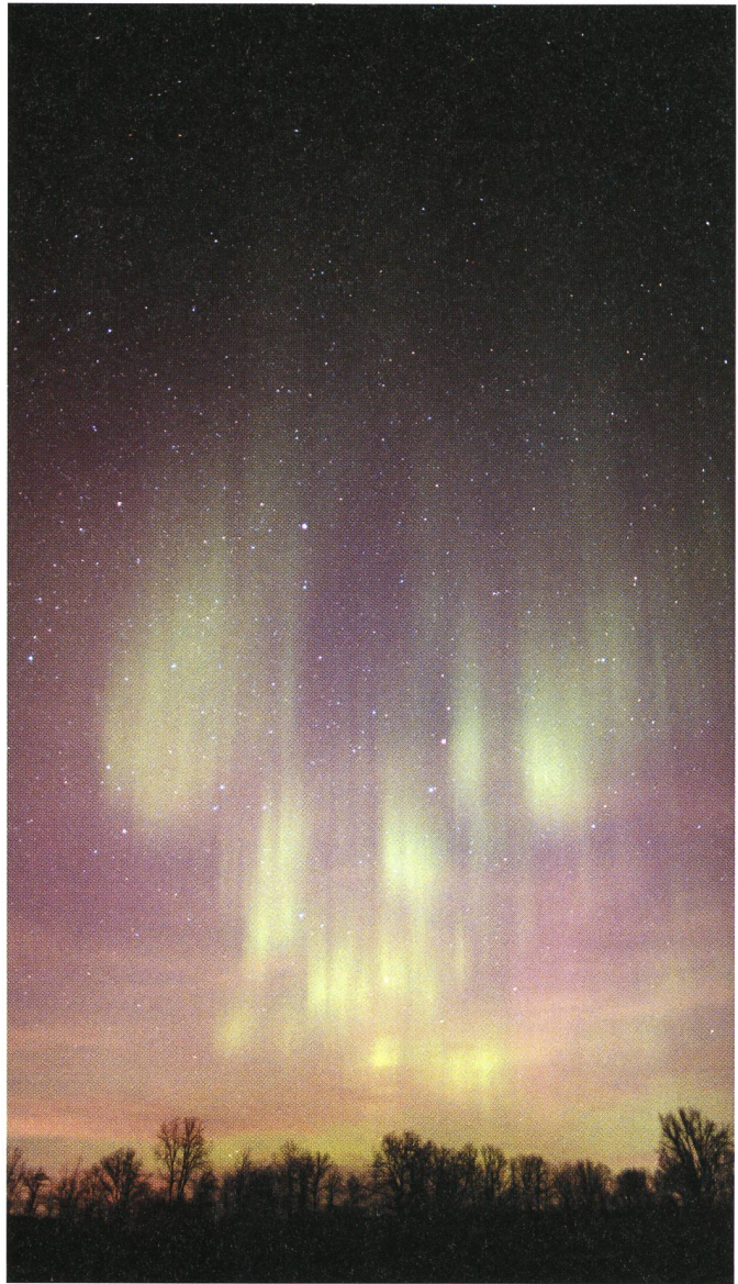
Fig. 3: 0858 UTC Film: Fuji NPZ (ISO 800) Canon F1, Canon 24/1.4L @ f/1.4, 40-50 seconds.