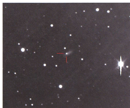
Cette photographie de la supernova «2003lb» a été prise le 29 décembre 2003 avec le «Télescope Bernard Comte» de 610 mm et une caméra CCD FLI Maxcam CM2-1 (pose de 600 secondes sans filtre).

La circulaire IAUC 8260, publiée par le CBAT le 29 décembre suivant, précise la nature et le type de la supernova