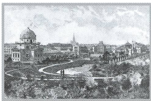
L'Observatoire Astronomique de Strasbourg et son histoire multinationale (4) - 21