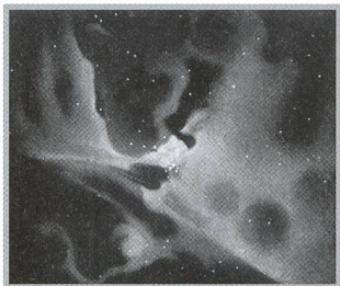
L'Univers, dis-moi ce que c'est? - 27