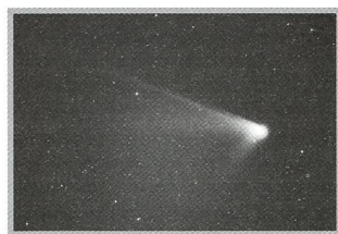
Komet NEAT C/2001 Q4 - 28