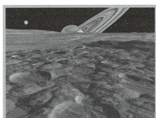
Visualisierung anderer Welten - 12