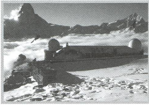
Aspects of Geneva Photometry - 4