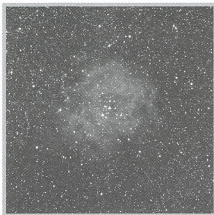
Farbfotografie mit der Maksutov-Kamera - 17