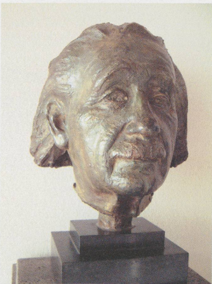
Einstein-Büste in der Eingangshalle des Gebäudes für exakte Wissenschaften der Universität Bern.

Im Jahre 2005 veröffentlichte ALBERT EINSTEIN, damals noch Mitarbeiter beim Eidgenössischen Patentamt in Bern, fünf bedeutende wissenschaftliche Arbeiten, von denen drei einen Umsturz in den damaligen Ansichten der Physik hervorriefen. Es handelt sich um Arbeiten zur speziellen Relativitätstheorie, zur Photonenhypothese sowie zur Brownschen Bewegung. Dieses denkwürdige Jahr ging als annus mirabilis in die Wissenschaftsgeschichte ein und wird 2005 zum hundertsten Mal gefeiert. Einige lokale und nationale Organisationen führen aus diesem Anlass Erinnerungsveranstaltungen durch. Ein grosser Teil ist für die Öffentlichkeit bestimmt und dürfte auch für unsere Leserschaft von Interesse sein. Folgende Auswahl von Anlässen seien hier erwähnt: