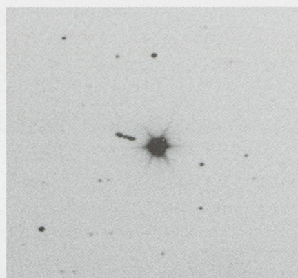
Ein Kleinplanet steuert direkt auf einen helleren Stern zu.

CHRISTOF SAUTER Weinbergstrasse 8, CH-9543 St. Margarethen TG