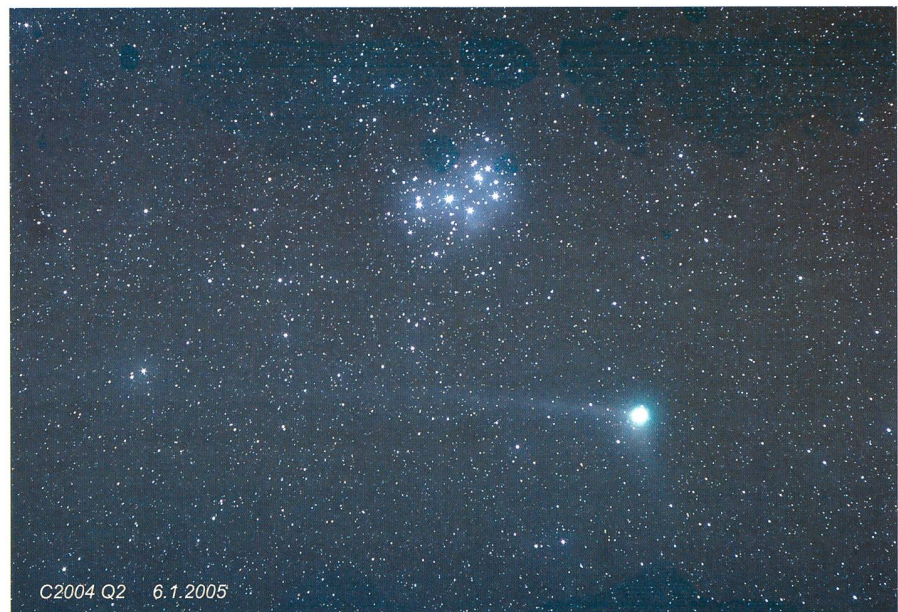
Nikon D70 1600 ASA, lunette Orion 80. Temps de pose: 5 min.

A partir de ce moment-là, ce ne sont pas moins de 200 jours par an qui sont consacrés aux visites, et plus de 3000 personnes se rendent chaque année à l'obser-