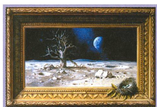
LUDEK PESEK – Realist und Visionär - Teil 3 - 10