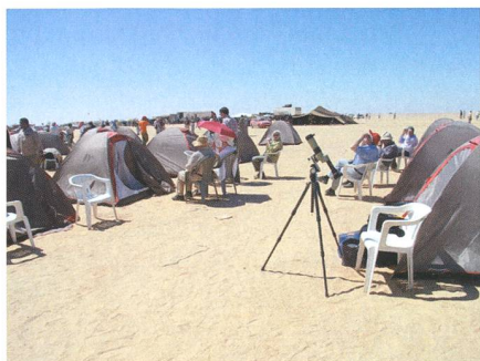
Die VISTA-Reisegruppe im Beobachtungscamp.

Schon früh bemerkte man, dass Finsternisse immer in die Zeiten von Voll- und Neumond fallen und gleichartige Sonnen- und Mondfinsternisse nach 18 Jahren und 11 Tagen wiederkehren. Schon in der Antike wurden Sonnenfinsternisse aufgezeichnet, die in Babylon bereits im 3. Jahrtausend v. Chr. zur Entdeckung des Saroszyklus führten. Ein Saroszyklus, auch als Sarosperiode oder chaldäische Periode bekannt, ist der Zeitraum zwischen der Wiederkehr zweier sich entsprechender Finsternisse innerhalb einer Finsternisperiode und entspricht einem Zeitabschnitt von 6585,3 Tagen, nach deren Ablauf der