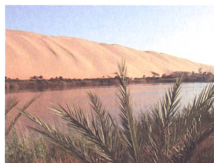
Oase mit Dattelpalme, einer der Mandara Seen und Sanddüne.

portagen bietet, war auch libyschen und ausländischen Medienschaffenden nicht entgangen. Mit Notizblock, Mikrophon, Filmkameras und anderen Utensilien bewaffnet versuchten sie, für ihre Auftraggeber geeignete Sujets einzufangen und unkonventionelle Interviews aufzuzeichnen.