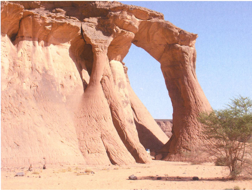
Pittoreske Felsen in der libyschen Wüste (Bild: ERWIN SCHLATTER, Zürich).