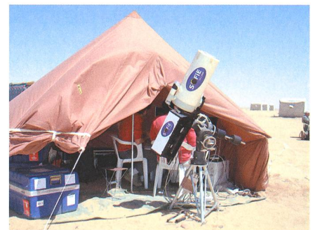
Cassegrain 210 mm freie Öffnung mit dem vom Wissenschaftsteam des Astronomischen Inst. der ETHZ entwickelten Astrografen.

Wer Libyen nur als Wüstenstaat wähnt, wird östlich der grossen Syrte in den grünen Bergen von Cyrenaika eines anderen belehrt. Auf dieser riesigen Hochebene, wo während unserer Reise der Frühling in voller Blüte stand, konn-