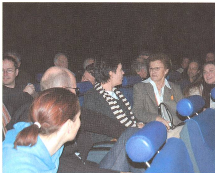
Gespanntes Warten auf den Beginn der Vorführung.

Zum Glück sah es dann am Samstag Nachmittag viel besser aus. Bereits gegen 16:00 Uhr waren schon mehr als 140 Ticketreservierungen abgeholt worden, und schliesslich war bei Beginn der Vorführung das Planetarium fast vollständig gefüllt.