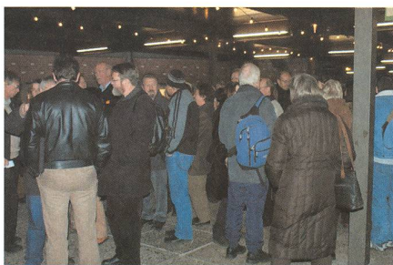
Grosses Gedränge vor dem Verkehrshaus.

Um 17:00 warten 205 gespannte Zuschauer aus der ganzen Schweiz in den bequemen Stühlen auf den Beginn der Vorstellung. Mit einer aus astronomischer Sicht völlig bedeutungslosen kleinen Verspätung von 10 Minuten beginnt um 17:10 Uhr die Vorführung.